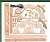
10209 Schwibbogen Krippe