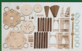
10193 Pyramide 2-stöckig für 6 Teelichte Größe ca. 30x30x40cm