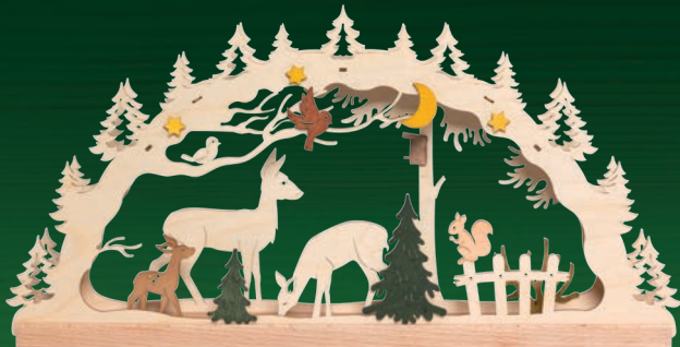
10211 Schwibbogen Wald