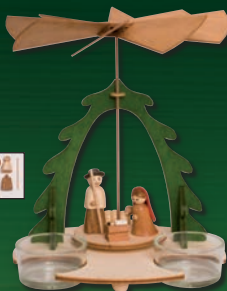
10104 mit Krippenfiguren