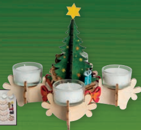
10133 Adventsleucher Größe ca. 21x21x17 cm