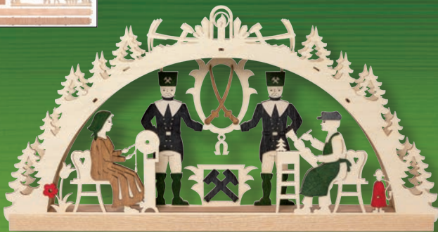
10219 LED- Schwibbogen Erzgebirge