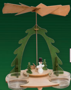
10103 Pyramide mit Schneemann Höhe ca. 18 cm