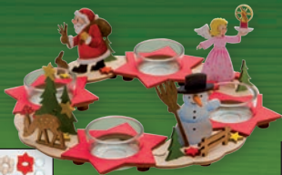
10108 Adventskranz Höhe ca. 8 cm