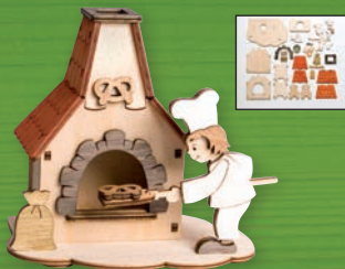
10126 Rauchhaus Backofen Größe ca. 12x12x9 cm