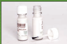
T 60014 10 ml Berliner Holzkaltleim Ex- press in Kunststofffläschchen mit Pinsel. Ideal zum Kleben der Bastelsets.