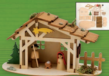
10109 Krippenstall Größe ca. 18x10x9 cm