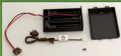
Beleuchtungsset 10113 Größe ca. 6x7,5 cm für Krippenstall 10109 und Fensterstern 10123, incl. LED und Batteriefach für 3 x 1,5 V Batterien = 4,5 V