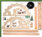
10210 Schwibbogen Schneemann